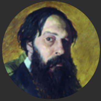
Алексей Саврасов (1830-1897)