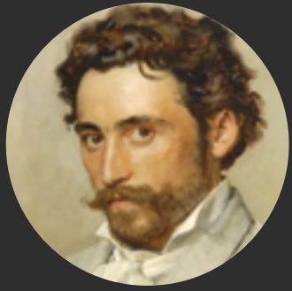
Илья Репин (1844-1930)