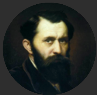
Василий Перов (1833-1882)