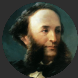
Иван Айвазовский (1817-1900)