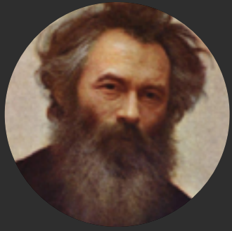
Иван Шишкин (1832-1898)