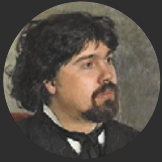
Василий Суриков (1848-1916)